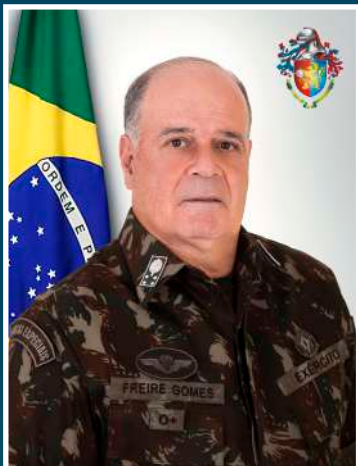
Gen Ex MARCO ANTÔNIO FREIRE GOMES Comandante do Exército

O cenário contemporâneo é desafiador e difícil de ser caracterizado. A ordem mundial que emergirá, após a pandemia e os conflitos atuais, permanece uma incógnita. As circunstâncias instigam a sociedade brasileira a buscar por respostas inovadoras ajustadas às ameaças e à realidade do nosso País.